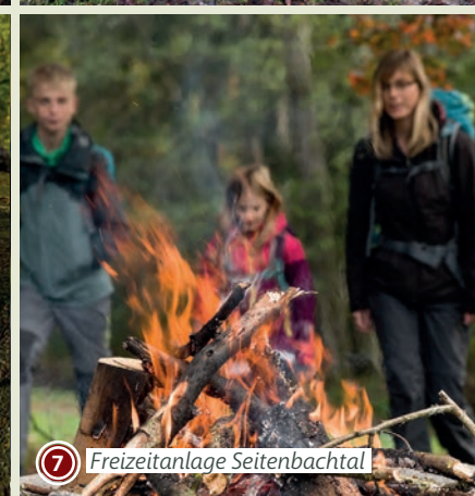
7 Freizeitanlage Seitenbachtal