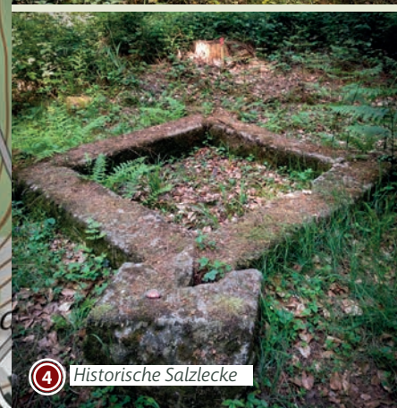
4 Historische Salzlecke