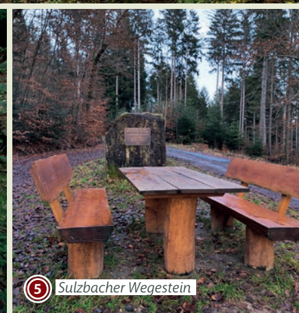
5 Sulzbacher Wegestein