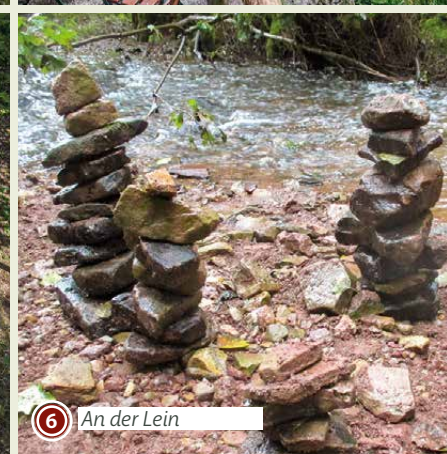
6 An der Lein