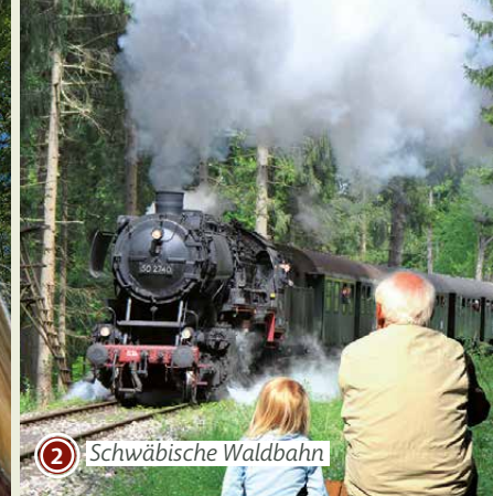
2 Schwäbische Waldbahn