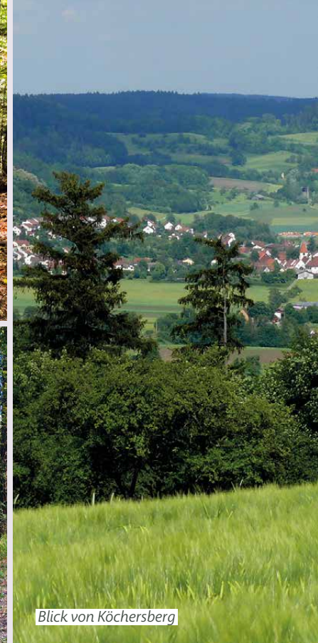
Blick von Köchersberg