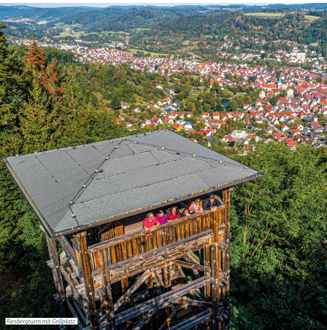
Riesbergturm mit Grillplatz